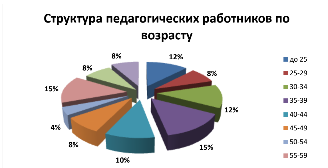
Диаграмма 6. 2

Данные диаграммы 2 «Структура педагогических работников по возрасту» подтверждает потенциальную работоспособность коллектива. Основной состав представлен возрастным интервалом от 31 до 59 лет, который характеризуется стабильной работоспособностью, высоким потенциалом профессионального совершенствования и карьерного роста. Около 8% педагогического коллектива старше 65 лет.